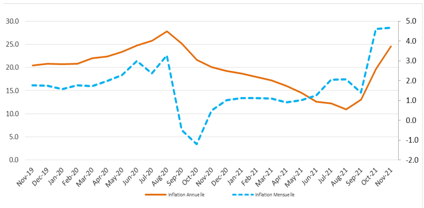
Graphique 1. Évolution de l'inflation mensuelle et annuelle en novembre 2021 (en %)

Par ailleurs, le taux d'inflation mensuel cumulé sur les deux premiers mois de l'exercice fiscal 2021-2022 a atteint 9,3 % contre -0,7 % sur la même période de l'exercice précédent. Considérée en moyenne mensuelle, l'inflation s'est établie à 4,65 % contre -0,35 % l'exercice antérieur. Ce taux moyen d'inflation mensuel (octobre et novembre 2021) reste de loin supérieur à celui enregistré chez nos principaux partenaires commerciaux (États-Unis : 0,85 % et République Dominicaine : 0,86 %).