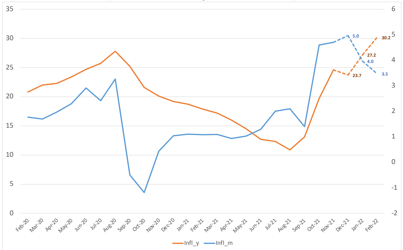
Graphique 3. Prévisions de l'inflation en variation mensuelle et annuelle sur trois mois (en %, décembre 2021, janvier et février 2022)